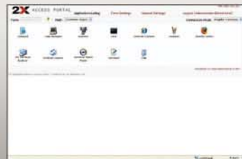
Portal für Browser-basierten Anwendungszugriff